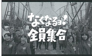
2017年春スペースワールドCM「所信表明篇」